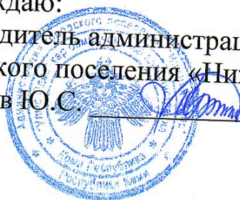
СХЕМА ТЕПЛОСНАБЖЕНИЯ ГОРОДСКОГО ПОСЕЛЕНИЯ «НИЖНИЙ ОДЕС» НА ПЕРИОД С 2014 ДО 2029 ГГ. (АКТУАЛИЗИРОВАННАЯ РЕДАКЦИЯ)