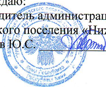
СХЕМА ТЕПЛОСНАБЖЕНИЯ ГОРОДСКОГО ПОСЕЛЕНИЯ «НИЖНИЙ ОДЕС» НА ПЕРИОД С 2014 ДО 2029 ГГ. (АКТУАЛИЗИРОВАННАЯ РЕДАКЦИЯ)