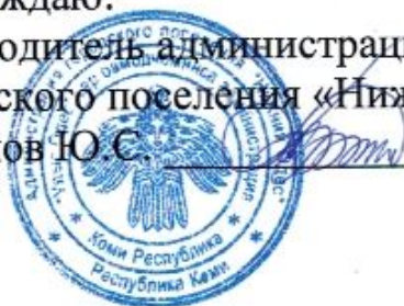
СХЕМА ТЕПЛОСНАБЖЕНИЯ ГОРОДСКОГО ПОСЕЛЕНИЯ «НИЖНИЙ ОДЕС» НА ПЕРИОД С 2014 ДО 2029 гг. (АКТУАЛИЗИРОВАННАЯ РЕДАКЦИЯ)